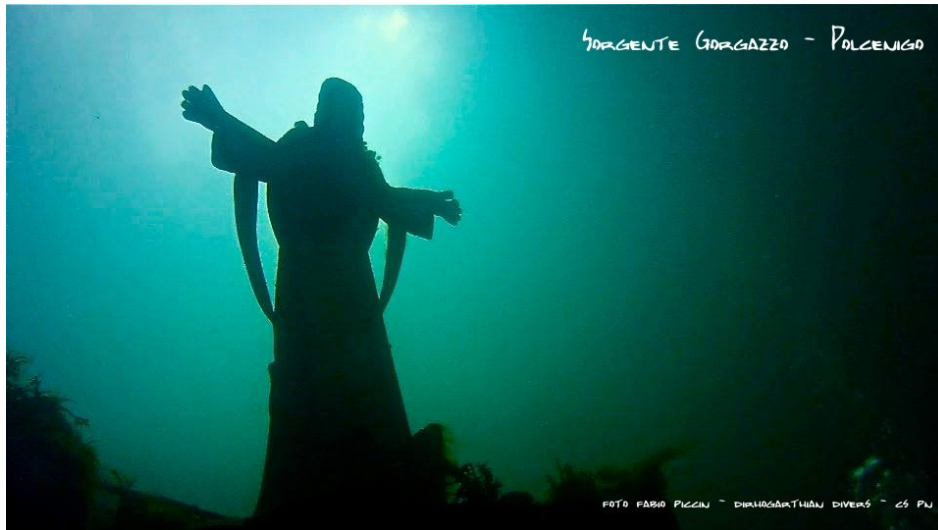
Fig. Il Cristo sorgente del